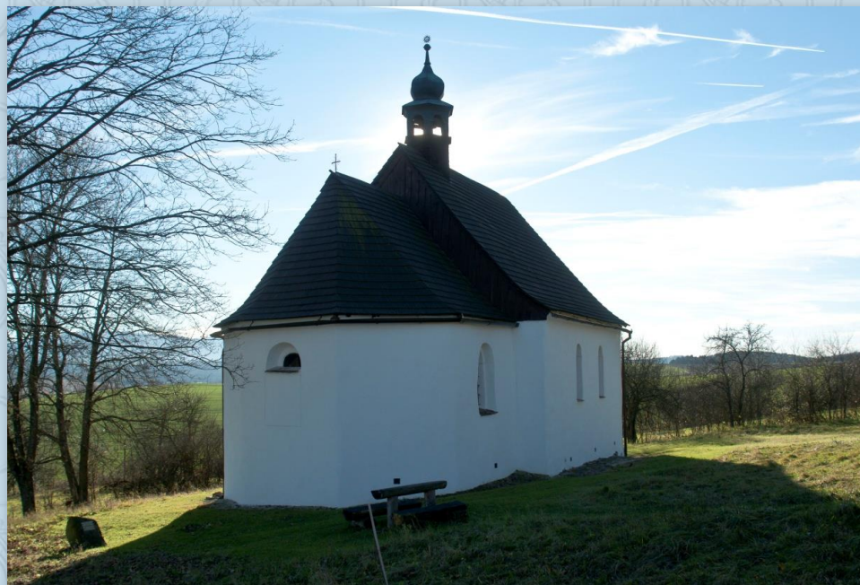
Kostel Sv. Václava - Brůdek