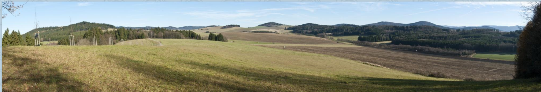
Pohled od kostela Sv. Anny

Z pamětihodností obce Všeruby stojí za zmínku kostel sv. Archanděla Michaela, který byl založen v r.1628, a celá stavba byla dokončena o dvacet dva let později. Kostel byl po požáru v r. 1852 rekonstruován a nově opraven v letech 1990-1991. V roce 2010 byla opravena také náves před kostelem a pamětní deska ke vzpomínce pobytu spisovatelky Boženy Němcové.